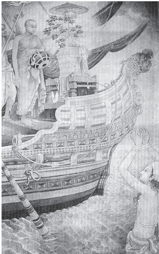
พระเจ้าเทวานัมปิยติสสะ แห่งศรีลังกา ทรงลุลำน้ำมารับ หนอพระศรีมหาโพธิ์จาก พระนางสังฆมิตตา พระธิดา ของพระเจ้าอโศกมหาราช

ฝ่ายพระเจ้าเทวานัมปิยติสสะก็เสด็จไปรับกิ่งพระศรีมหาโพธิ์ถึงท่าชมพุกโกละ เสด็จลงไปในทะเลลึกถึงพระศอ เพื่อรับกิ่งพระศรีมหาโพธิ์ ทรงบูชาด้วยเครื่องบูชาต่าง ๆ แล้วทรงยกกระถางที่ประดิษฐานกิ่งพระศรีมหาโพธิ์ วางบนพระเศียรแล้วจึงเสด็จขึ้นจากทะเล พร้อมด้วยบุคคลในตระกูลชั้นสูง 16 ตระกูล ทรงพักกิ่งพระศรีมหาโพธิ์ไว้ที่ริมทะเลเพื่อสักการบูชาเป็นการใหญ่