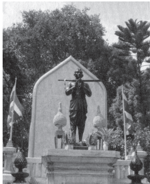
อนุสาวรีย์กรมพระราชวังบวรมหาสุรสิงหนาท (บุญมา) วัดมหาธาตุ ด้านหลังคือพระศรีมหาโพธิ์ต้นแรกจากศรีลังกา