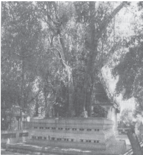
โพธิ์ต้นแรกจากศรีลังกา ปลูกที่วัดมหาธาตุยุวราชรังสฤษฎิ์ ทำพระจันทร์ที่ 2 โปรดฯ ให้ปลูกไว้ที่วัดมหาธาตุยุวราชรังสฤษฎิ์ ทำพระจันทร์