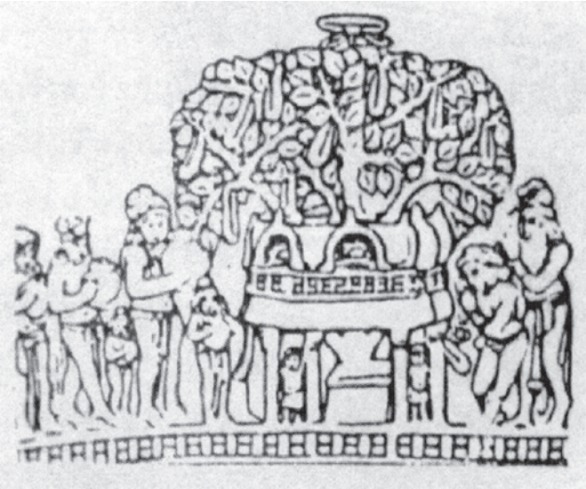
ต้นโพธิ์ในป่า (โพธิอาคาร) พระเจ้าอโศกและข้าราชการบริพารกำลังรดน้ำต้นโพธิ์ที่งอกงามอยู่ในโพธิอาคาร เป็นภาพอยู่บนทับหลังที่สลัวจี

ภาพการบูชาพระศรีมหาโพธิ์ในอินเดีย ก่อนที่จะมีการสร้างพระพุทธรูป