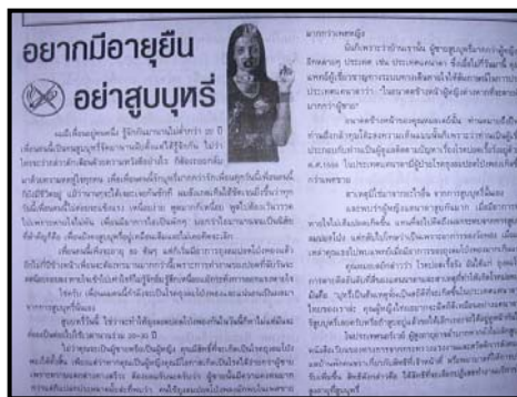
ภาพที่ 4.5 การให้ความรู้ผ่านทางสื่อสิ่งพิมพ์

การศึกษานั้นมิใช่มีเพียงในโรงเรียนหรือสถาบันการศึกษาใด ๆ เท่านั้น เพราะคนเราต้องแสวงหาความรู้อยู่ตลอดเวลาเพื่อการมีชีวิตที่ดีขึ้น เพื่อประโยชน์ในการทำงาน เพื่อการพัฒนาให้ทันกับการเปลี่ยนแปลงในทุกด้าน เพราะโลกของวิทยาการสาขาต่าง ๆ ก้าวหน้าอย่างรวดเร็ว ไม่มีที่สิ้นสุด การแสวงหาความรู้จึงจำเป็น และมนุษย์สามารถแสวงหาความรู้ได้จากสื่อสิ่งพิมพ์ ซึ่งมีส่วนสำคัญอย่างมากในการให้ความรู้แก่มวลชนได้อย่างกว้างขวาง สามารถแพร่กระจายข่าวสารได้อย่างรวดเร็ว จึงมีสำคัญในการให้ความรู้ ความคิด และประสบการณ์ใหม่ ๆ แก่มวลชน ดังภาพที่ 4.5