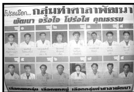
ภาพที่ 4.1 บทบาทของหนังสือพิมพ์ท้องถิ่นที่มีต่อการเมือง

สื่อสิ่งพิมพ์โดยเฉพาะหนังสือพิมพ์ทั้งระดับชาติและระดับท้องถิ่นนับได้ว่าเป็นสื่อประเภทหนึ่งที่ถูกนำมาใช้เป็นเครื่องมือทางการเมืองตลอดมา และในทางตรงข้ามการเมืองก็เป็นตัวกำหนดรูปแบบ บทบาทของสื่อสิ่งพิมพ์เช่นกัน ดังภาพที่ 4.1