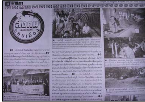
ภาพที่ 4.4 การให้ข่าวสารทางสังคม