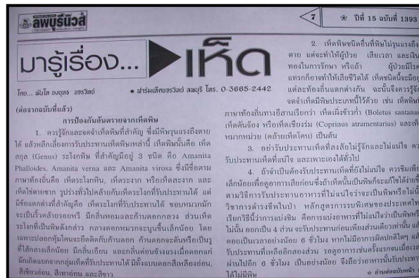
ภาพที่ 4.3 บทบาทของสื่อสิ่งพิมพ์ที่มีการต่อศึกษา ที่มา (ยงยุทธ ขจรวิทย์, 2546, หน้า 7)

บทบาททางการศึกษาและสาระความรู้ที่เป็นประโยชน์ต่อการพัฒนาการศึกษาในสาขานั้น ๆ หรือ แม้แต่สิ่งพิมพ์เฉพาะกิจที่หน่วยงานต่าง ๆ จัดทำขึ้นนั้นก็ถูกนำมาใช้ในบทบาทพัฒนาทางการศึกษาเช่นเดียวกันกับสื่อสิ่งพิมพ์อื่น