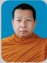
พระครูภาวนาโสภณ